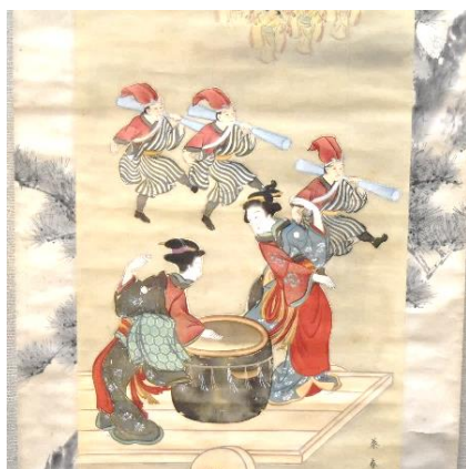
和歌祭図〈江戸時代〉

新収蔵品展のなかで、江戸時代や大正時代に描かれた和歌祭の絵画資料を展示しています。