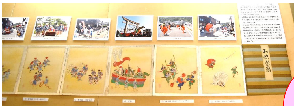
和歌祭図〈大正9年=1920年〉