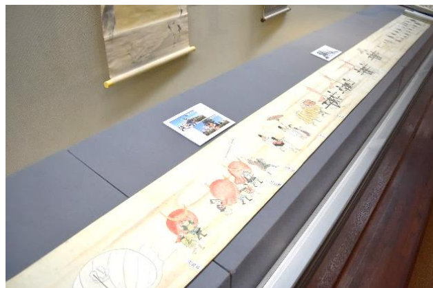
和歌御宮行列絵巻〈江戸時代〉